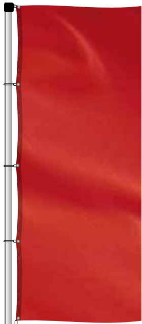
fertig konfektioniertes (Sichtmaß/Endmaß)