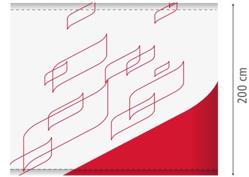
Endmaße vom fertigen Stoffdruck: 240 x 200 cm